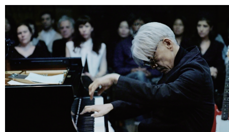
上映作「坂本龍一 PERFORMANCE IN NEWYORK:async」