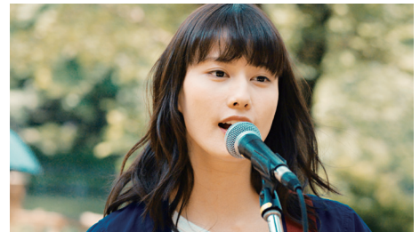
今回のイベントでの上映作「PARKS パークス」(2017年公開) ©2017 本田プロモーションBAUS 2017年/日本/118分/5.1ch/配給:boid 監督:瀬田なつき