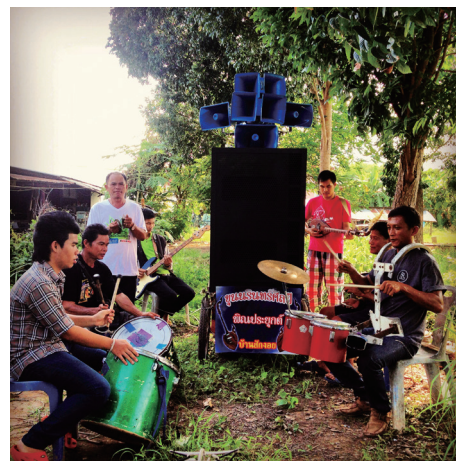
クン・ナリンズ・エレクトリック・ピン・バンド