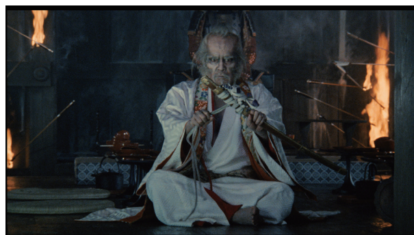
上映作「乱 4Kデジタル修復版」

スクリーン脇、天井、座席下、さらに座席周辺に設置された40台以上のスピーカー。そして、作品ごとに細部に渡って調整された上映環境。「日本最強」と謳われる爆音映画祭をこの機会にぜひお楽しみください。