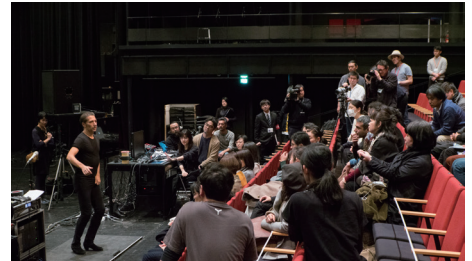
過去に開催した「イスラエル・ガルバン バックステージツアー」の様子 (2018年)

上映終了後、黒沢清監督を招き、アフタートークを開催します。（16:15 終了予定）